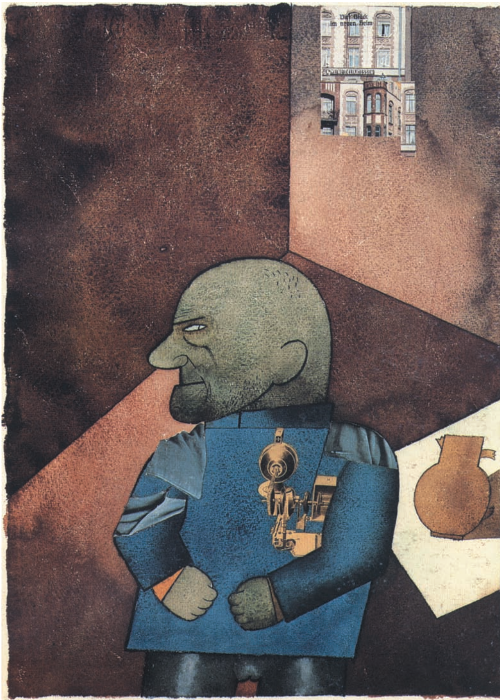
L'ingegner Heartfield (1920)

dagli articoli 579 e 580 del codice penale italiano, sono una manifestazione della pretesa di monopolizzare il potere di dare la morte, anche per uno Stato, come quello italiano, che ripudia la pena capitale.