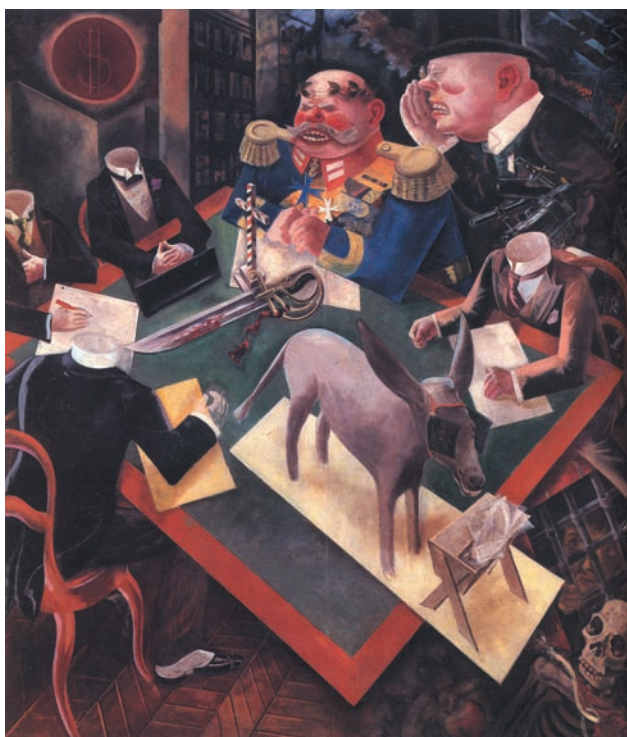
Eclissi di sole (1926)

perché la questione morale è il centro del problema italiano, ed ecco perché i partiti possono provare a essere forze di serio rinnovamento soltanto se affronteranno in pieno la questione morale andando alle sue cause politiche.»