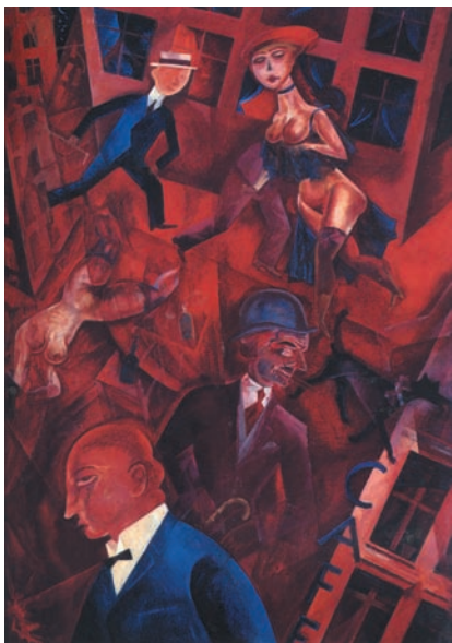
Dedicato a Oscar Panizza (1917-18)

A quel punto, sarà l'impresa stessa a mettersi in contatto con i nostri uffici.