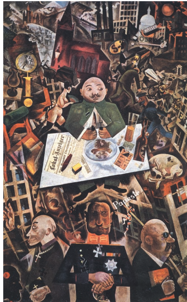
Germania, una fiaba d'inverno (1918)

Tuttavia, fu proprio in quel periodo che egli cominciò a rivedere le proprie posizioni. «Occorreva un bagno di economia politica», avrebbe poi annotato nei suoi ricordi autobiografici. «Occorrevano delle esperienze. E vennero. E venne il socialismo moderno.» Da quando, nel 1879, ottenne la scarcerazione e fu espulso dalla Francia, riparando nuovamente in Svizzera, Costa cominciò così a lavorare per dare all'Italia un movimento socialista moderno, che abbandonasse i suoi trascorsi anarchici e violenti per un approccio più moderato e riformista, vicino alle posizioni marxiste. Allo stesso tempo, egli era ben consapevole della necessità di “rituffarsi nel popolo” per meglio comprenderne le reali istanze. Era un fatto, del resto, che la maggior parte dei rivoluzionari italiani provenisse non dal proletariato, ma dal ceto borghese. Sempre nella lettera agli amici di Romagna, Costa affermava che «la cosa più importante da farsi è quella di ricostituire il Partito Socialista Rivoluzionario Italiano, che continuerà l'opera incominciata dall'Internazionale.» Sottolineando che «il popolo è di natura sua idealista e non si solleverà se non quando le idee socialiste abbiano per lui il prestigio e la forza di attrazione che ebbe un tempo la