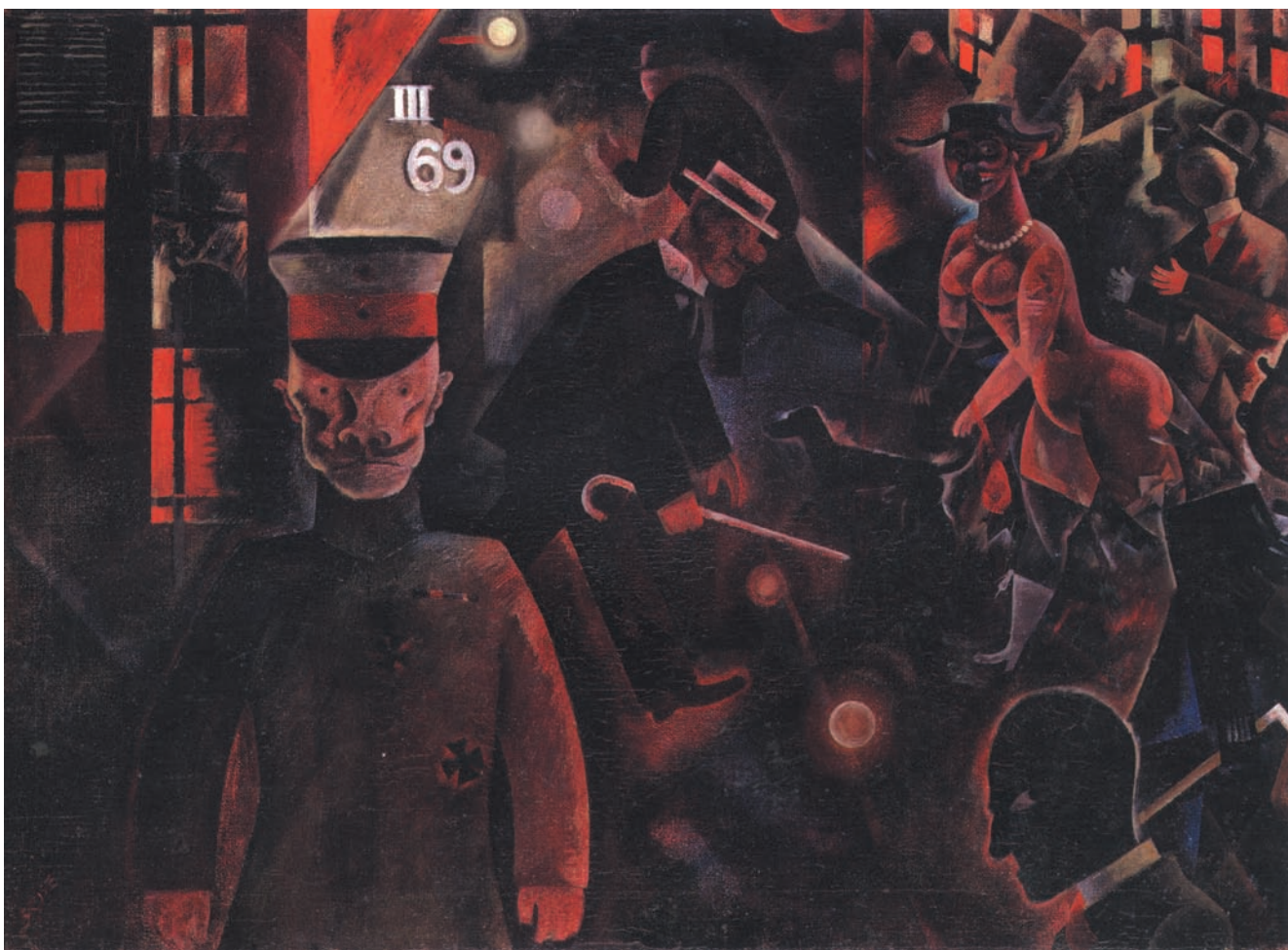
Strada pericolosa (1917)

sto successivo alla fondazione del Partito Socialista Rivoluzionario di Romagna (in seguito divenuto Partito Socialista Rivoluzionario Italiano). Poi, il grande passo: quando in parlamento cominciò il dibattito per le votazioni della legge sul suffragio universale, Costa iniziò a sostenere la necessità che il movimento socialista italiano partecipasse attivamente alla vita politica della nazione. Nel gennaio 1882 la riforma sul voto fu approvata, e in breve fu decisa la partecipazione dei socialisti alla campagna elettorale.