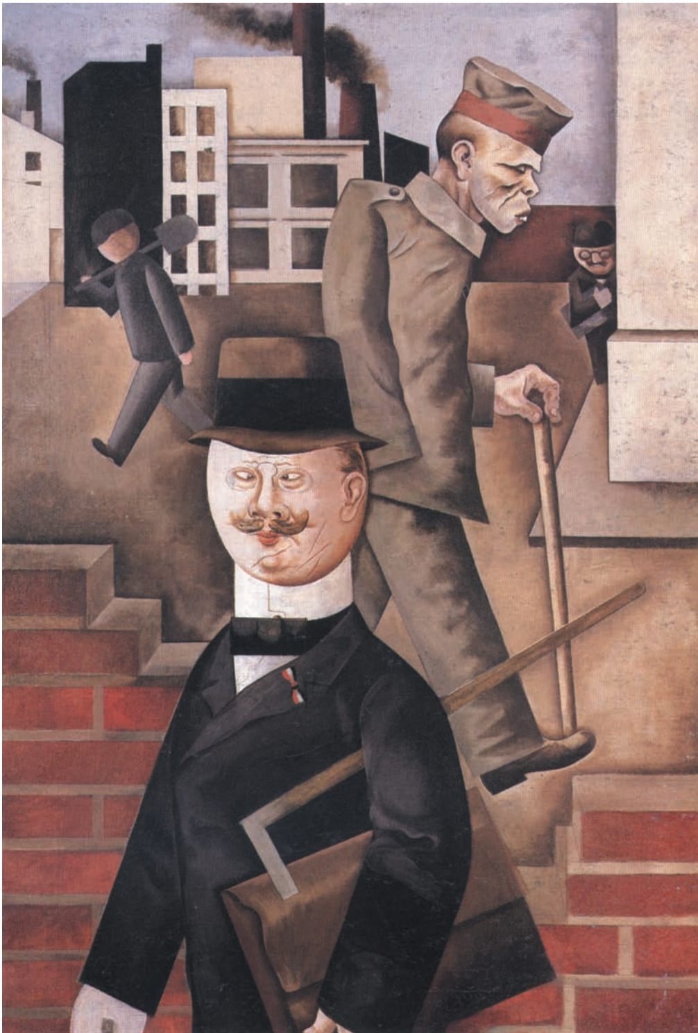
Giorno grigio (1921)

della Corte di Cassazione francese nel caso Perruche (un bambino francese nato con una malattia genetica a causa di un'errata diagnosi medica sulle condizioni di salute della madre) non l'avesse introdotta realmente nel mondo del diritto. Quest'ultimo si trova così alle prese con situazioni estreme mai sperimentate in migliaia di anni, rispetto alle quali le categorie tradizionali (nascita, decesso, persona, soggetto di diritto)