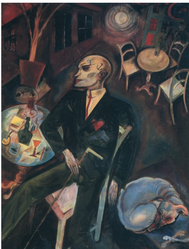
Il malato d'amore (1916)

un'importanza e un significato che vanno ben oltre le consuete celebrazioni di rito. Sottrarre all'oblio una figura di spicco del socialismo italiano come Costa è non solo doveroso, ma anche necessario per restituire alle nuove generazioni il senso e il valore di un'esperienza umana e politica che ha ancora molto da insegnarci.