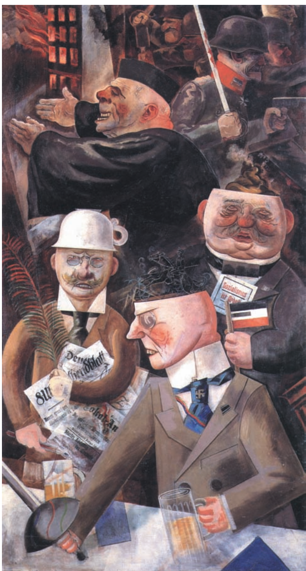
I pilastri della società (1926)

vegetativo. Insomma, se in me c'è ancora una possibilità di bios , anche artificiale o incosciente, si presume che vi sia necessariamente la volontà che il mio corpo sia mantenuto "in funzione". Così si spiega il divieto legale di rinunciare anticipatamente all'alimentazione artificiale. Nel secondo caso, la legge n. 91 del 1999 presume invece senza problemi che il silenzio (se consapevole, almeno in linea di principio) significhi assenso all'espianto dei propri organi in caso di morte, quando cioè si è superato il punto di non ritorno della vitalità biologica. Certo lo scopo, qui, può giustificare i mezzi: è in gioco la vita di qualcun altro. Entrambi i casi sono espressione di un potere dello Stato sul corpo, esposto nella sua nudità. Nel caso dell'espianto degli organi, la legge fa pressione per rendere indisponibile il destino del mio corpo, una volta che sarà morto, obbligando la mia