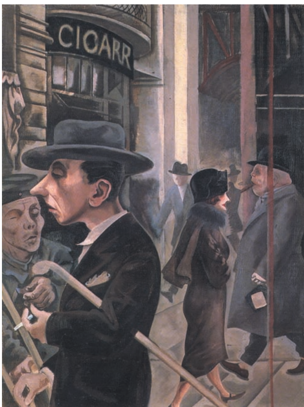
Scena di strada (1925)

questa differenza fondamentale rimanda, non casualmente, il concetto giuridico di dignità della persona umana . La persona malata ha un fondamentale diritto alla salute , cioè un diritto alla “buona vita”, dignitosa: ha il diritto a non essere “un paziente”, a non patire sofferenza (non solo fisica ma anche esistenziale). Ma – sia consentita quest’espressione, che può apparire forte, ma non deve essere fraintesa – non ha un diritto a non veder cessare le funzioni vitali, perché non ha né può essergli imposto un dovere di essere biologicamente vitale. Insomma: la volontà che vuole vivere non deve essere abbandonata e lasciata morire. Ma né la volontà di vita, né la volontà di morte possono essere presunte argomentando che l’esistenza biologica stessa “deve essere”, o magari che l’esistenza che non è (ancora o non più) non vuole essere. Questo significherebbe irreggimentare il divenire stesso dell’esistenza in una rigida struttura di diritti e doveri, di divieti e permessi. E questo sarebbe davvero un atto di hybris .