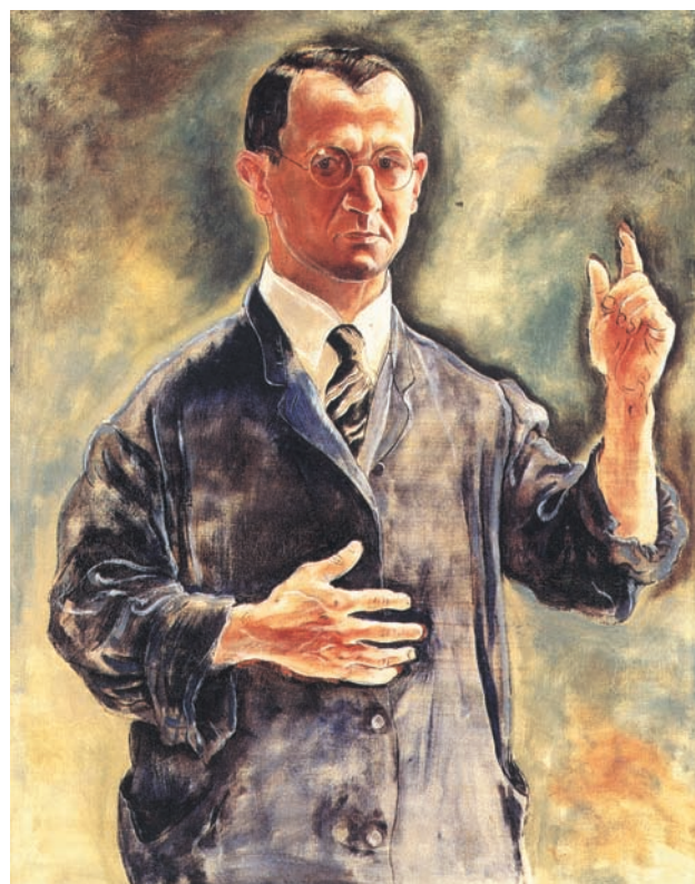
Autoritratto con lo pseudonimo di Warner (1927)

Nel 1920 Grosz e altri artisti organizzano nella galleria di Otto Burchard a Berlino la prima mostra dada, nella quale vengono presentati anche lavori di Marx Ernst e Otto Dix. In questa occasione, Grosz appende al