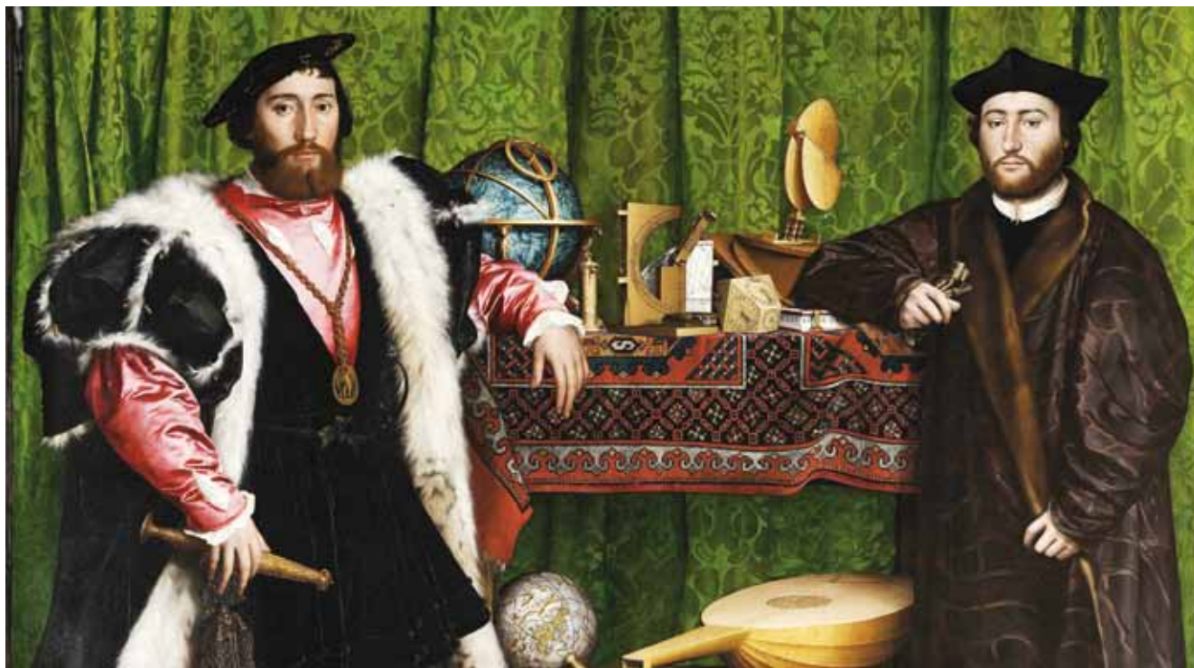
Gli ambasciatori (1533) - Part.

Le regioni italiane dove si crema di più in assoluto sono ovviamente quelle meglio dotate di impianti di cremazione: la Lombardia con 29.286 cremazioni (12 impianti presenti), il Piemonte con 18.992 cremazioni (11 impianti) e l'Emilia-Romagna con 15.384 cremazioni (9 impianti).