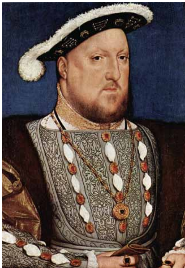
Enrico VIII, Re d'Inghilterra (1536-37) - Part.

La data del 13 febbraio 2015 ha segnato i settant'anni trascorsi dal bombardamento di Dresda da parte degli anglo-americani, che a pochi mesi dalla definitiva capitolazione del Terzo Reich scatenarono sulla splendida città tedesca – la “Firenze sull'Elba”, come la battezzò lo scrittore Johann Gottfried Herder nell'Ottocento – una vera e propria tempesta di fuoco radendola