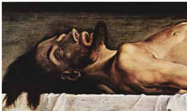
Cristo nel sepolcro (1521-22) - Part.

Dieci anni dopo Holbein, già in Inghilterra, dipinge Gli Ambasciatori e ci appare come un uomo molto diverso da quello del Cristo. L'olio su tavola, custodito presso