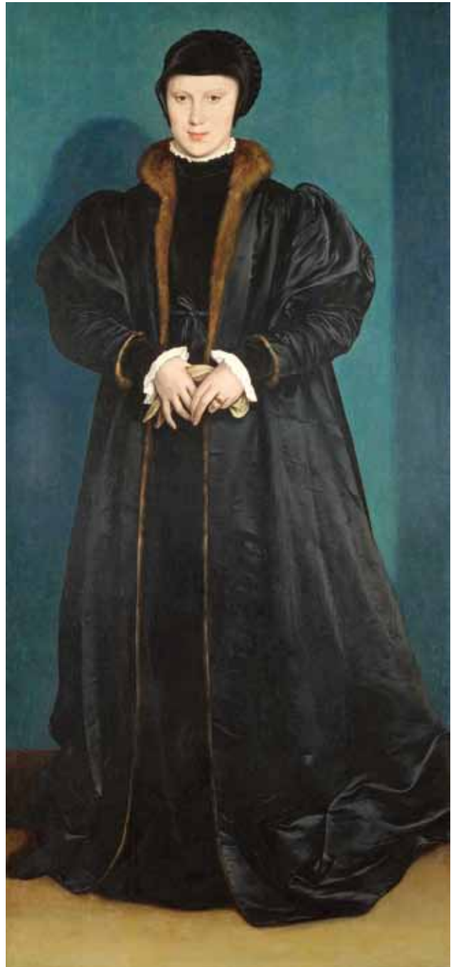
Cristina di Danimarca, Duchessa di Milano (1538)

Sarebbe lecito, a questo punto, sollevare alcune domande. Possiamo dire che, con episodi come quelli di Amburgo e Dresda (ma occorrerebbe menzionare anche il Giappone), gli angloamericani si sono posti allo stesso livello dei nazifascisti, emulandoli in violenza e barbarie? Lo sventramento di Dresda fu un tassello necessario per arrivare a sconfiggere definitivamente la