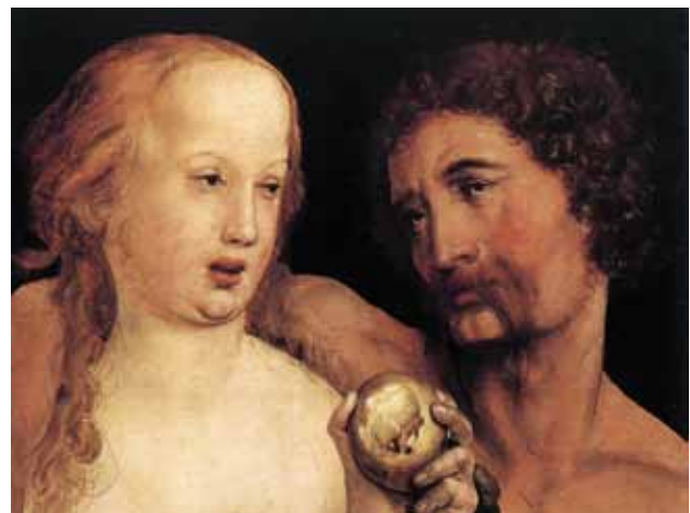
Adamo ed Eva (1517) - Part.

Tra le pubblicazioni promosse e curate dall'associazione si ricordano il prestigioso volume La Certosa di Bologna - immortalità della memoria (1998), che ha segnato una tappa importante del processo di riqualificazione e rivalutazione del cimitero bolognese, e la Guida alla Certosa di Bologna (2001).