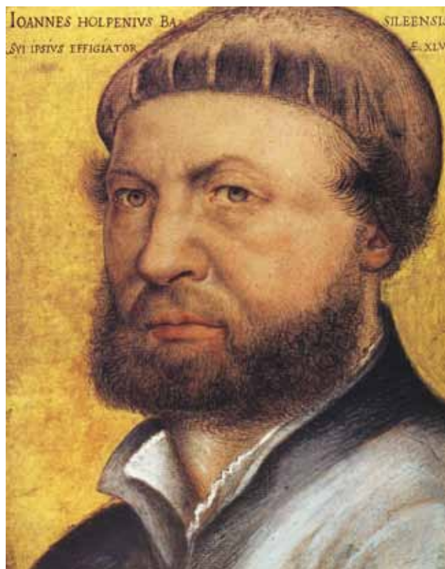
Autoritratto (1542 ca.)