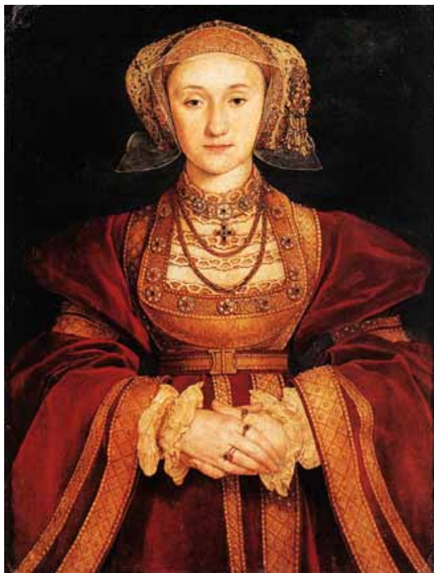
Anna di Cleve (1539)

contro l'umanità 2 . L'osservazione di McNamara, lodevole per onestà intellettuale, è tutt'altro che infondata – e in molti sarebbero disposti a sottoscriverla. Ma il punto centrale della questione, rispetto alle domande che abbiamo sollevato, non è tanto il condannare o l'assolvere, quanto il comprendere . Riflettendo sul mestiere di storico, Marc Bloch riteneva fosse molto più importante capire che giudicare 3 . Anche Edward H. Carr respingeva la visione dello storico come giudice, dando ragione a Benedetto Croce quando scriveva che “coloro che, assumendo di narrare storie, si affannano a far giustizia, condannando e assolvendo, perché stimano che questo sia l'ufficio della storia (...) sono concordemente riconosciuti manchevoli di senso storico” 4 . Carr, tuttavia, faceva un'importante distinzione: lo storico deve sì esimersi dal condannare i singoli individui, ma non può mantenere un atteggiamento indifferente e neutrale nei confronti di eventi, istituzioni e ordinamenti politici del passato. Il motivo è semplice: l'interpretazione storica implica sempre e necessariamente un giudizio di valore.