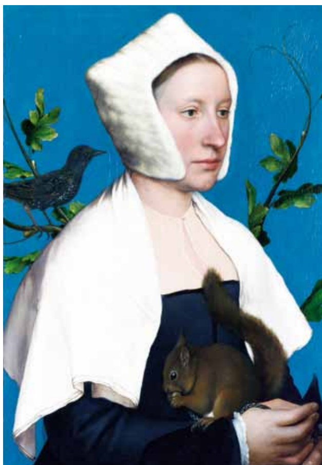
Dama con scoiattolo e gazza (1528) - Part.

D'altra parte, in presenza di questa tendenza culturale